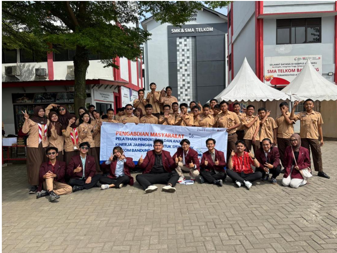
Gambar 5. Foto bersama antara peserta dengan tim pelaksana

Sebagai penutup, kegiatan diakhiri dengan sesi refleksi dan penyampaian kesimpulan mengenai materi yang telah dipelajari selama pelatihan. Pada sesi ini, peserta bersama tim pelaksana dan guru pendamping melakukan diskusi singkat mengenai pengalaman selama mengikuti kegiatan serta manfaat yang diperoleh dari pelatihan. Selanjutnya, seluruh peserta dan tim pelaksana melakukan sesi foto bersama sebagai bentuk dokumentasi kegiatan sekaligus simbol terjalinnnya kolaborasi antara perguruan tinggi dan SMK Telkom Bandung dalam upaya meningkatkan kompetensi siswa di bidang telekomunikasi. Dokumentasi tersebut diharapkan dapat menjadi bagian dari rekam jejak pelaksanaan kegiatan pengabdian kepada masyarakat serta mendukung keberlanjutan kerja sama pada program-program berikutnya. Foto bersama antara peserta dan tim pelaksana dapat dilihat pada Gambar 5.