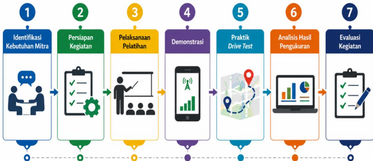
Gambar 2. Tahapan pelaksanaan kegiatan pengabdian masyarakat

Pelaksanaan kegiatan pengabdian kepada masyarakat dilakukan secara sistematis melalui lima tahapan utama, yaitu identifikasi kebutuhan mitra, persiapan kegiatan, pelaksanaan pelatihan, praktik drive test dan analisis hasil pengukuran, serta evaluasi kegiatan. Tahapan tersebut dirancang untuk memastikan bahwa materi yang diberikan sesuai dengan kebutuhan peserta dan tujuan pelatihan dapat tercapai secara optimal. Alur pelaksanaan kegiatan pengabdian ditunjukkan pada Gambar 2.