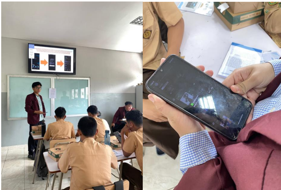
Gambar 4. Pelaksanaan kegiatan pengabdian kepada masyarakat

Seluruh rangkaian kegiatan berlangsung sesuai dengan jadwal yang telah direncanakan dan diakhiri dengan sesi diskusi, tanya jawab, serta penyampaian kesimpulan mengenai materi yang telah dipelajari. Antusiasme peserta terlihat selama kegiatan berlangsung, terutama pada saat pelaksanaan praktik drive test dan analisis hasil pengukuran, di mana peserta secara aktif berdiskusi mengenai hasil yang diperoleh pada masing-masing kelompok. Dokumentasi pelaksanaan kegiatan ditampilkan pada Gambar 4.