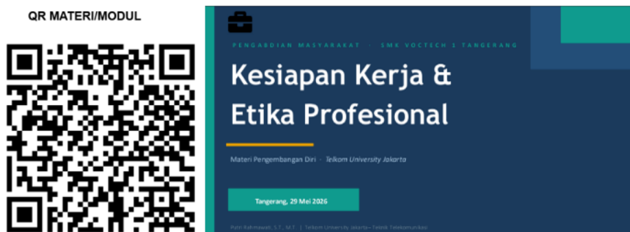
Gambar 4. kegiatan pengabdian masyarakat pada SMK Voctech 1 Tangerang (Modul)

Sebagai tindak lanjut, tim pengabdian berencana menambahkan sesi praktik simulasi wawancara kerja secara langsung pada kegiatan pendampingan berikutnya, mengingat sesi tersebut belum dapat dilaksanakan secara optimal pada kegiatan pertama karena keterbatasan waktu dan jumlah peserta. Tindak lanjut lain meliputi penyusunan modul job readiness dan personal branding yang lebih lengkap untuk digunakan secara mandiri oleh guru pada kegiatan bimbingan karier rutin, serta pelatihan personal branding berbasis platform digital tertentu, sehingga manfaat kegiatan dapat dirasakan lebih optimal oleh siswa SMK Voctech 1 Tangerang yang akan memasuki dunia kerja maupun program PKL. Pada Gambar 4 terlihat untuk tampilan depan modul materi serta QR akses materi modul pengabdian masyarakat.