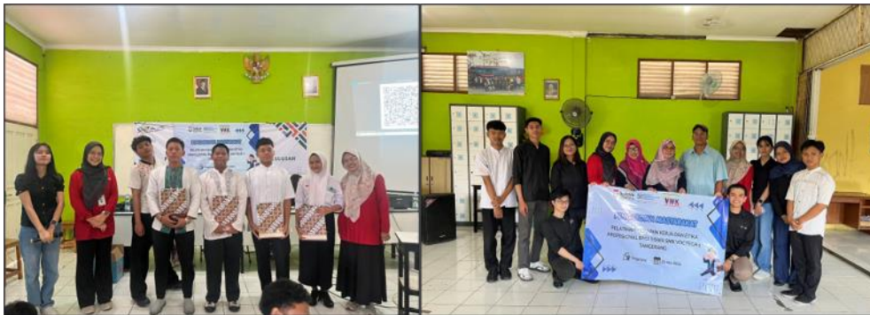
Gambar 3 kegiatan pengabdian masyarakat pada SMK Voctech 1 Tangerang

Hasil kegiatan ini menunjukkan bahwa pelatihan yang memadukan pemaparan materi dengan sesi diskusi dan tanya jawab mampu meningkatkan pemahaman dan keterlibatan peserta secara lebih efektif dibandingkan dengan metode ceramah satu arah. Temuan ini sejalan dengan beberapa kajian sebelumnya yang menunjukkan bahwa pembekalan soft skill dan kesiapan kerja melalui pendekatan interaktif dan partisipatif terbukti efektif dalam meningkatkan kesiapan kerja siswa SMK [9], [10]. Selain itu, penguatan kemampuan interpersonal melalui sesi diskusi interaktif juga dinilai penting untuk mempersiapkan siswa berinteraksi secara profesional di lingkungan kerja [11]. Kendala yang ditemui antara lain durasi pelatihan yang relatif terbatas serta jumlah peserta yang cukup banyak (124 siswa), sehingga sesi praktik langsung seperti simulasi wawancara kerja belum dapat dilaksanakan secara optimal pada kegiatan ini. Pihak sekolah menyambut baik pelaksanaan kegiatan dan berharap pelatihan serupa dapat dilaksanakan secara berkelanjutan dengan durasi yang lebih panjang.