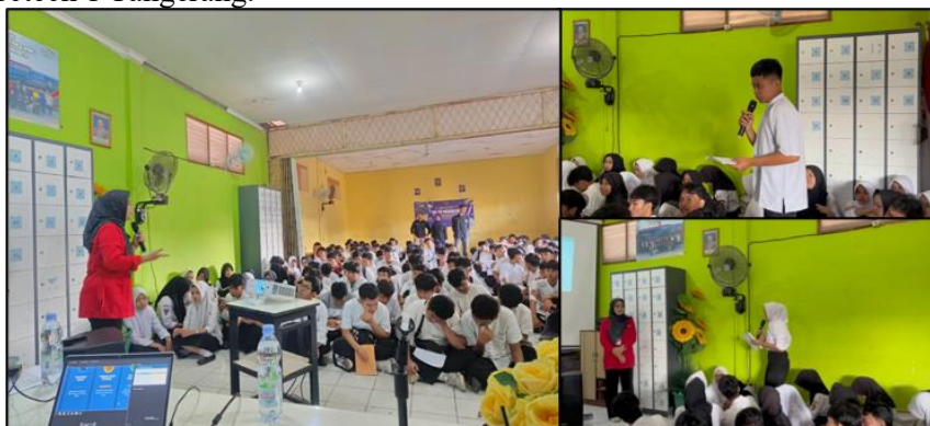
Gambar 1. Kegiatan Pengabdian Masyarakat pada SMK Voctech 1 Tangerang

Kegiatan pelatihan job readiness dan personal branding dilaksanakan pada 29 Mei 2026 dan diikuti oleh 124 siswa kelas XI SMK Voctech 1 Tangerang. Kegiatan dibuka dengan pemaparan materi mengenai pentingnya kesiapan kerja di era digital, dilanjutkan dengan materi teknis penyusunan CV dan surat lamaran kerja, wawancara kerja, serta materi strategi dan etika personal branding di media sosial. Tingkat partisipasi yang aktif pada peserta, khususnya pada sesi diskusi dan tanya jawab. Sebagian besar peserta menunjukkan keterlibatan yang tinggi dalam diskusi meskipun pada awal kegiatan masih terlihat keraguan dan kurangnya rasa antusias. Gambar 1 menunjukkan dokumentasi pelaksanaan kegiatan pelatihan job readiness dan personal branding di SMK Voctech 1 Tangerang.